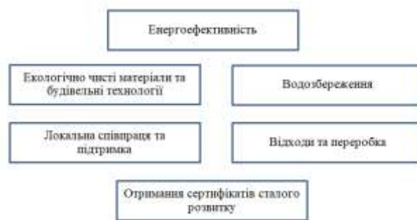
Рис.1 - Ключові фактори зеленого готельного бізнесу з позиції екологічної відповідальності

здійснювалося із розумінням важливості екологічності готелів (рис. 2).