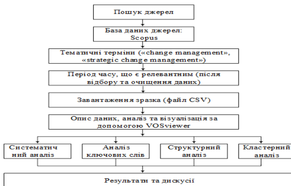
Рисунок 1 - Узагальнена схема методології дослідження