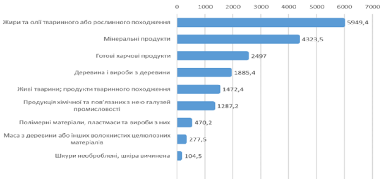
Рисунок 1 – Експорт України, млн доларів США

розблокуванню українських портів. У липні під тиском міжнародних партнерів Російська Федерація погодилася на 120-денну «зернову ініціативу», яка