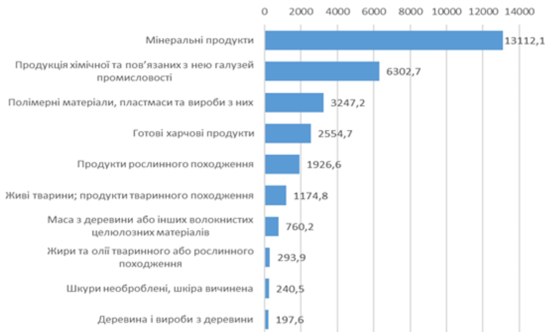
Рисунок 2 – Імпорт України, млн долл США

завдання на 40% менше попереднього року. Те, що станеться з наступною кампанією теплої погоди, залежатиме від реалізації та розширення Зернової