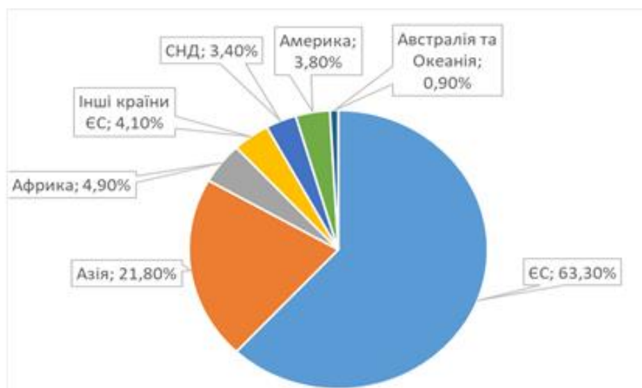
Рисунок 4 – Експорт України за регіонами