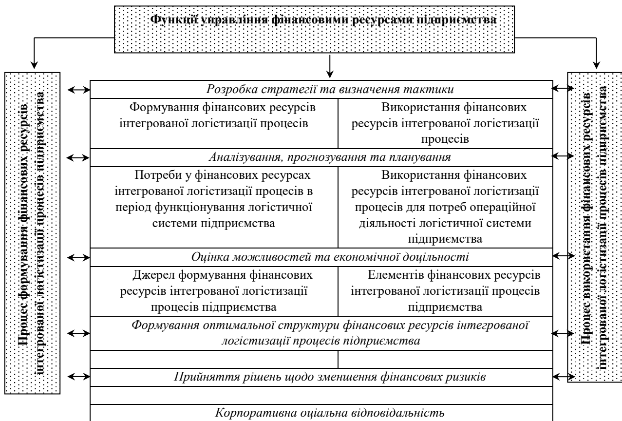
Рисунок 2 – Функції управління фінансовими ресурсами інтегрованої логістики процесів підприємства

Цілі стратегії корпоративного забезпечення промислового підприємства мають підпорядковуватися загальній стратегії економічного розвитку [6, с. 2-30; 7, с. 152-158].