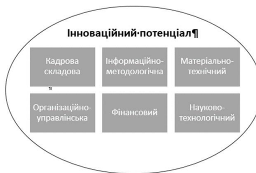
Рис. 1 – Компоненти інноваційного потенціалу

Задля формулювання поняття інноваційного потенціалу розглянемо його компоненти. Відповідно до аналізу різних підходів до визначення компонентів, запропоновано виділити наступні ( рис. 1).