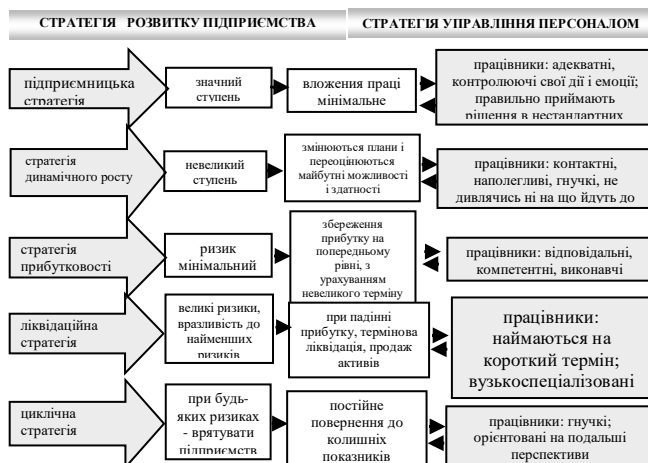
Рис. 2 - Взаємозв'язок стратегії управління персоналом і стратегії розвитку підприємства

Найчастіше підхід до управління кадрами вибирається залежно від того, який тип стратегії організації має місце. Їх існує кілька типів, при цьому, взаємозв'язок стратегії управління персоналом і стратегії розвитку підприємства найпряміший (див. рис. 2).