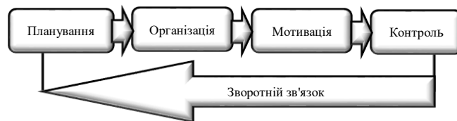
Рисунок 1 – Основні функції управління підприємства

окремим випадком менеджменту, яке відповідно до визначення М. Мескона [5] передбачає 4 основні функції управління: планування, організація, мотивація, контроль, а також два сумісних процесу: процес комунікації і процес прийняття рішень (рисунок 1).