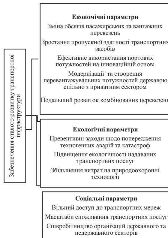
Рис.2 Параметри сталого розвитку транспортної інфраструктури

Прийняття рішень на засадах сталого розвитку передбачає врахування їх наслідків для майбутніх поколінь, що особливо важливо для транспортного сектору як тієї галузі, яка дозволяє реалізувати наявні та потенціальні конкурентні переваги (рис. 2).