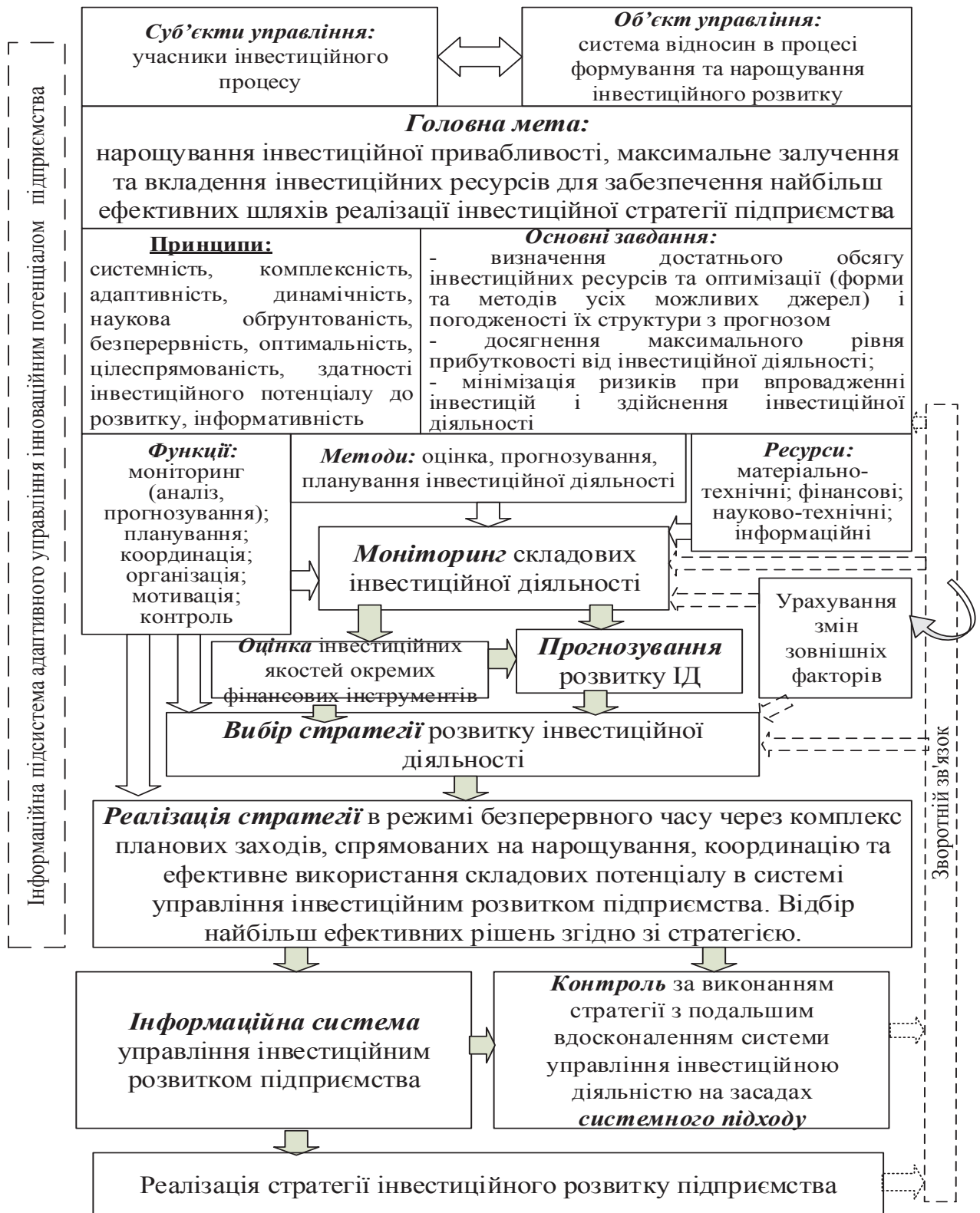
Рисунок 2 – Механізм управління інвестиційною діяльністю підприємства

сформувані універсальний та дієвий механізм інвестиційної діяльності підприємства з урахуванням сучасних умов функціонування (рис. 2)