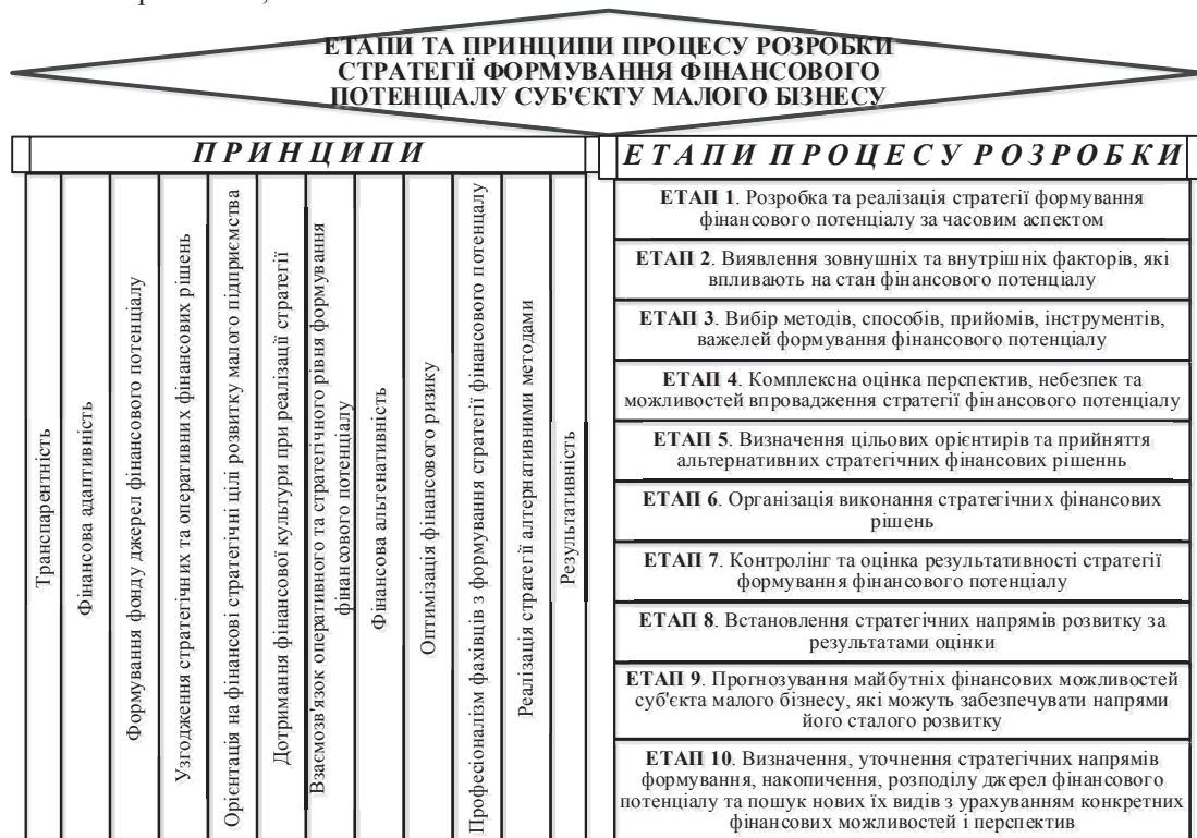
Рисунок 2 – Послідовність етапів процесу розробки стратегії формування фінансового потенціалу корпорації, що базуються на спеціальних принципах [9-12]

Процес розробки стратегії формування фінансового потенціалу малого підприємства здійснюється етапами, що конкретизуються при поступальному русі до позначених стратегічних цілей (рис. 2).