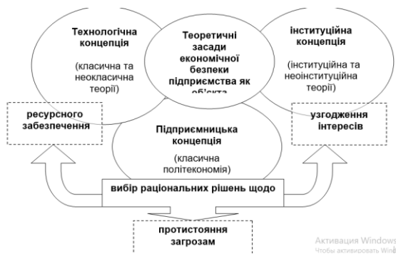
Рисунок 2 – Теоретичні засади економічної безпеки підприємства як об’єкта управління

висвітлюють лише окремі аспекти його діяльності, через що їх можна вважати валідними. Тому узагальнюючою має бути така інтеграційна концепція, в рамках якої підприємство виконує роль системного інтегратора різноманітних соціально-економічних процесів у часі і просторі. При цьому ключовою ланкою є інтеграція у часі, тобто забезпечення безпечного існування та розвитку підприємства. Таке теоретичне розуміння сутності підприємства потребує концептуалізації управління економічною безпекою підприємства, адекватної та такої, яка не суперечить як теперішнім, так і майбутнім умовам розвитку підприємства. Графічну інтерпретацію використання такого групування концепцій у площині управління економічною безпекою підприємства подано на рис. 2 [11].