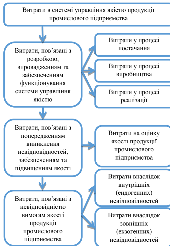
Рис.1 – Витрати в системі управління якістю продукції промислового підприємства (узагальнено авторами на основі [8, 11])

Луцюк І.В. пропонує класифікувати витрати на якість за етапами процесу управління якістю: планування якості – постановка цілей підприємства щодо поліпшення якості продукції, фінансування розробки та впровадження системи управління якістю, пошук ресурсів для забезпечення ефективного функціонування системи, встановлення зв'язків з іншими системами та підсистемами підприємства; управління якістю – безпосередня робота щодо забезпечення якості продукції підприємства, затвердження положень з якості для підприємства, навчання персоналу та ознайомлення з міжнародними стандартами якості продукції; забезпечення впевненості у якості – виконання вимог стандартів з якості, завоювання довіри споживача за рахунок випуску якісної продукції; поліпшення якості продукції – підвищення ефективності та результативності управління якістю, проведення сертифікації продукції, тобто надання споживачеві доказів високої якості продукції підприємства [6].