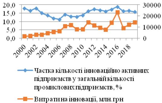
Рис.2 – Витрати на інновації промислових підприємств України за 2000-2019 р.р. (побудовано авторами за даними [7])

14112 млн. грн. або на 60,75%. У 2019 році обсяг витрат на інновації зростає по відношенню до 2017 року на 5103,4 млн. грн. або на 55,97%, але є нижчим за рівень 2016 року на 9008,6 млн. грн. або на 38,78%.