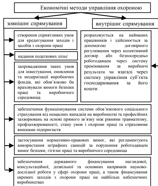
Рис. 1 – Зовнішні та внутрішні економічні методи управління охороною праці (узагальнено [3,4,6])

управляють, поділяються на методи зовнішнього та внутрішнього спрямування (рис.1).