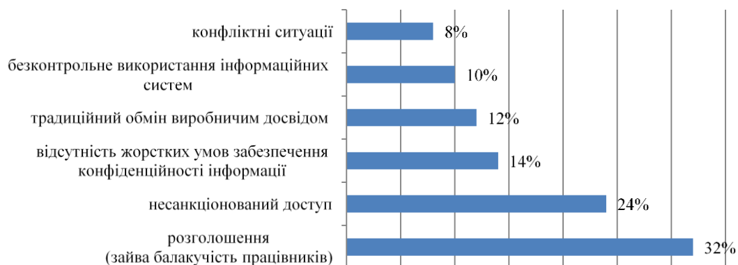
Рисунок 1 - Внутрішні та зовнішні загрози економічній безпеці підприємства