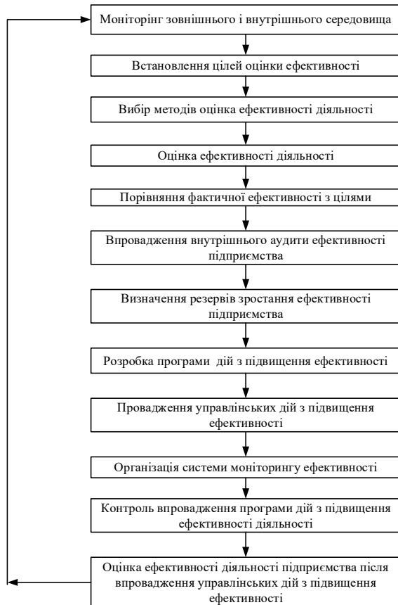
Рисунок 2 – Структурна схема організаційного забезпечення управління ефективністю діяльності підприємств виноробної галузі

економічними ризиками, маркетинговою діяльністю, кадровою політикою підприємства, його конкурентоспроможністю.