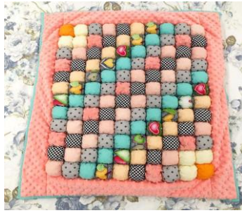
Рис. 1 –Зовнішній вигляд ковдри по техніці «Бонбон»

З розвитком і вдосконаленням дрібної моторики кисті і пальців рук напряму пов'язано розвиток центральної нервової системи та формування психічних процесів, мови. Аналіз і синтез при обробці інформації в центральній нервовій системі забезпечує свідомий відбір найбільш відточених моторних функцій. При поліпшенні моторних функцій дитина відчуває себе більш комфортно в будь-якій ситуації, в будь-якому середовищі.